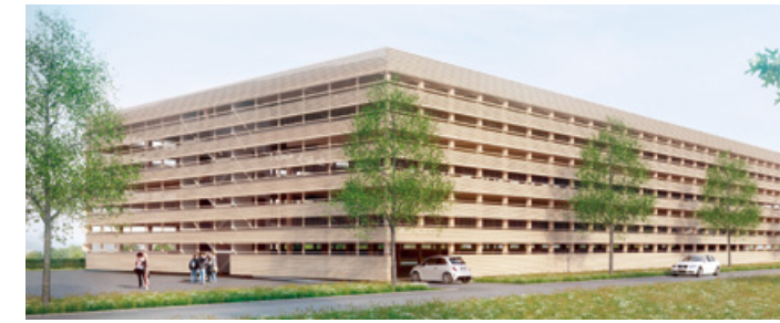
Bausystem für Parkhäuser aus Buchen-Furnierschichtholz