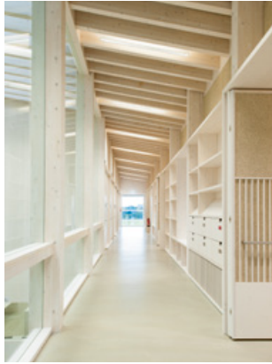
Schmuttetal-Gymnasium in Diedorf